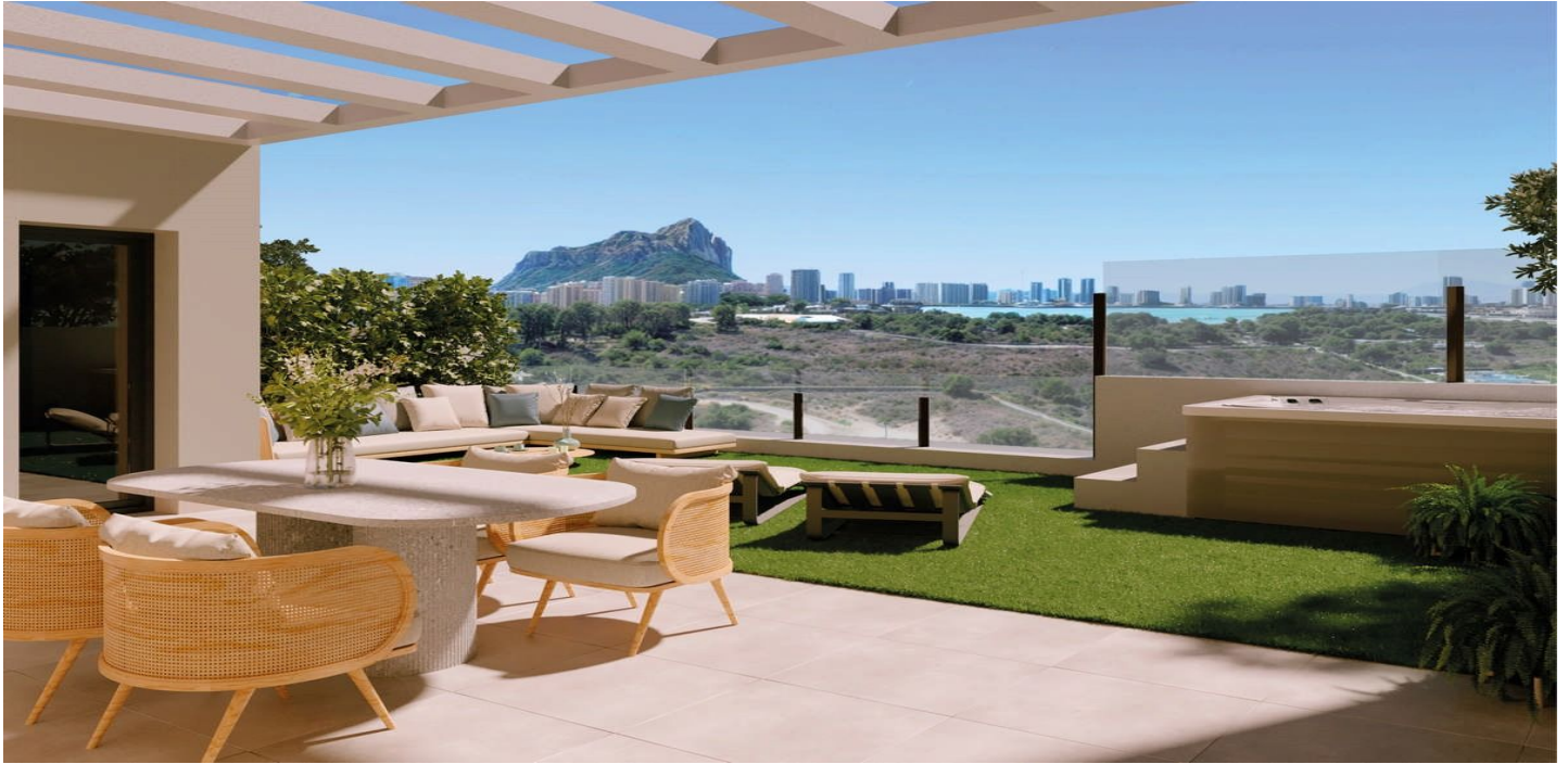
VIVIENDA C BLOQUE 01 PLANTA BAJA

Referenz: R5131810 Schlafzimmer: 3 Badezimmer: 2 Garten: 206m 2