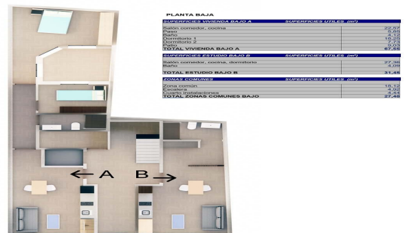
Planta Baja. Estudio B y Vivienda A