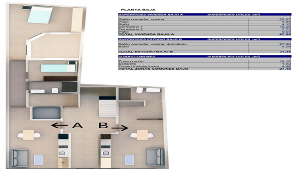
Planta Baja. Estudio B y Vivienda A