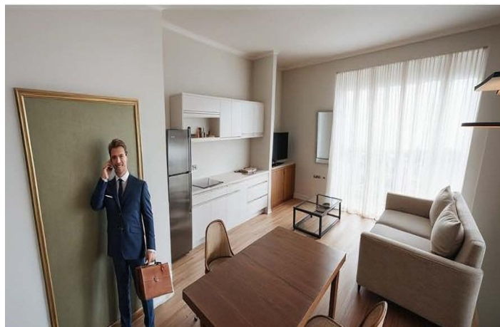
Planta Primera y segunda. Estudio B y Vivienda A